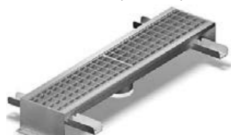
Purusränna 100 för betonggolv med L15 galler och mittutlopp

Purus golvrännor finns anpassade för betonggolv, epoxygol, vinylmatta med klämram, klinkergolv med limfläs, klinkergolv med klämram samt för klinkergolv med limfläs och iläggslåda där klinker eller motsvarande placeras, så kallad tile insert.